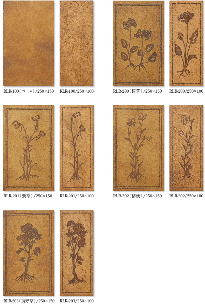
RLR-100(ベース)/250×150 RLR-100/250×100 RLR-200(桜草)/250×150 RLR-200/250×100 RLR-201(鸞草)/250×150 RLR-201/250×100 RLR-202(桔梗)/250×150 RLR-202/250×100 RLR-203(福寿草)/250×150 RLR-203/250×100