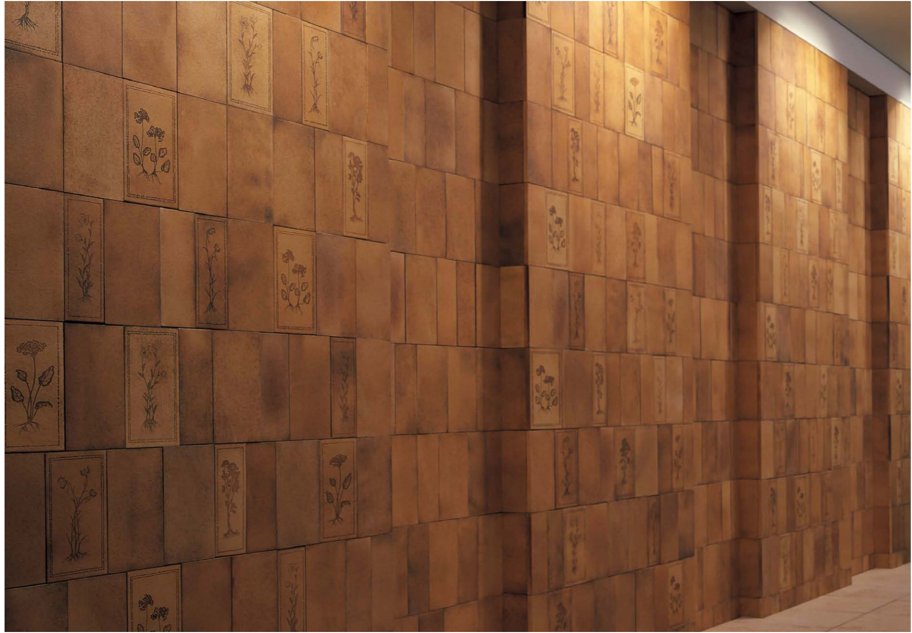
RLR-100/250×150, 250×100, RLR-200, 201, 202, 203/250×150, 250×100