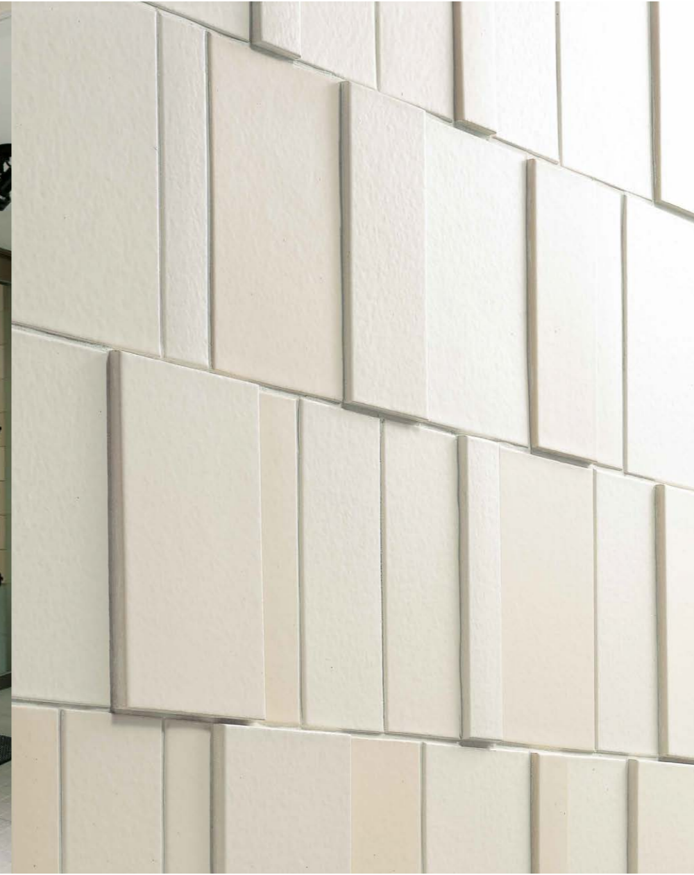
JPS-100, 101, 102/250×150, 250×100, 250×50, 250×150A, 250×100A, 250×50A