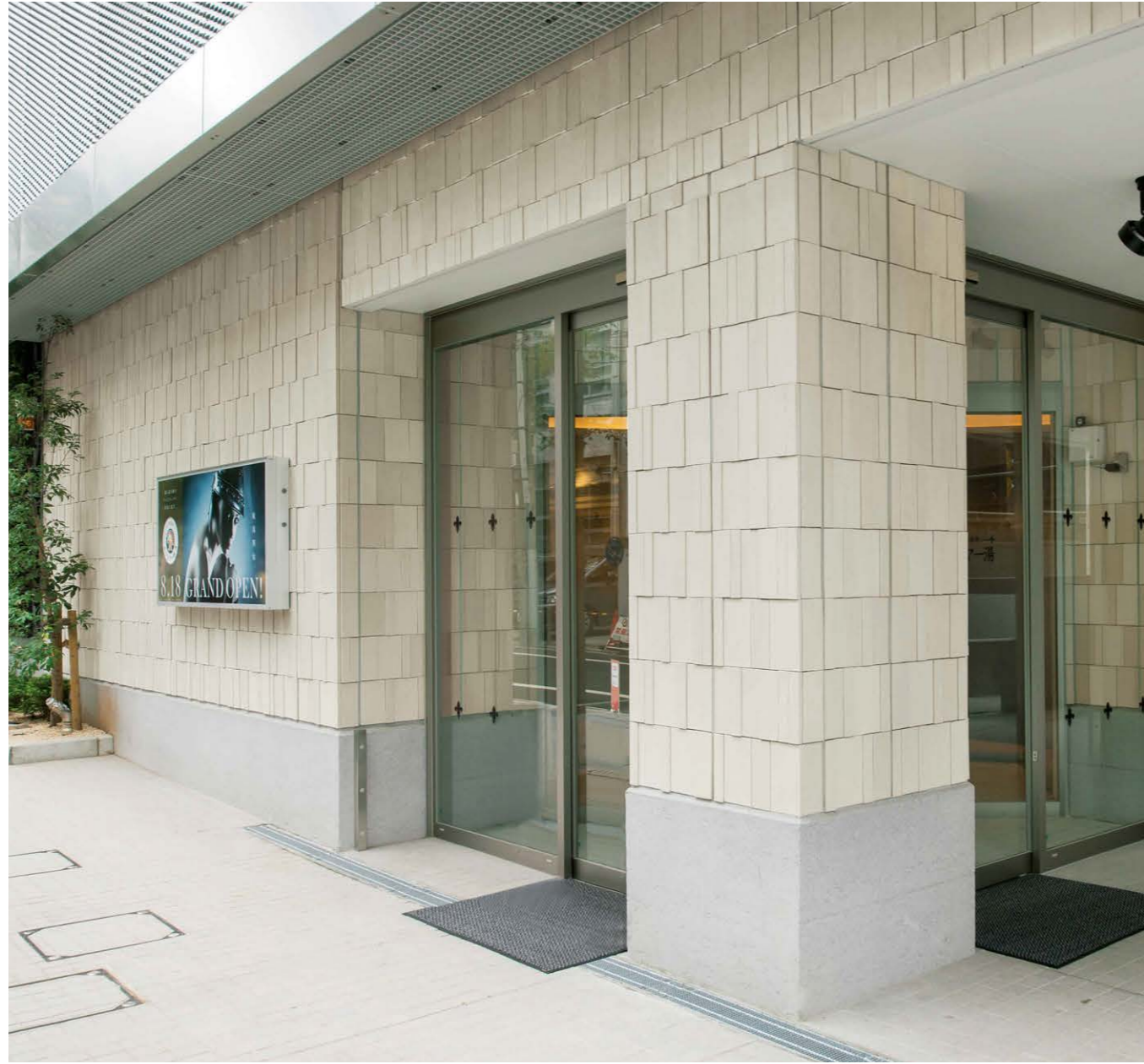
JPS-100, 101, 102/250×150, 250×100, 250×50, 250×150A, 250×100A, 250×50A