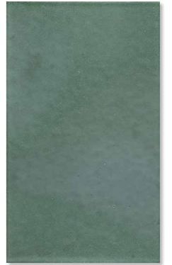
JPC-100 (ロップパーグリーン)