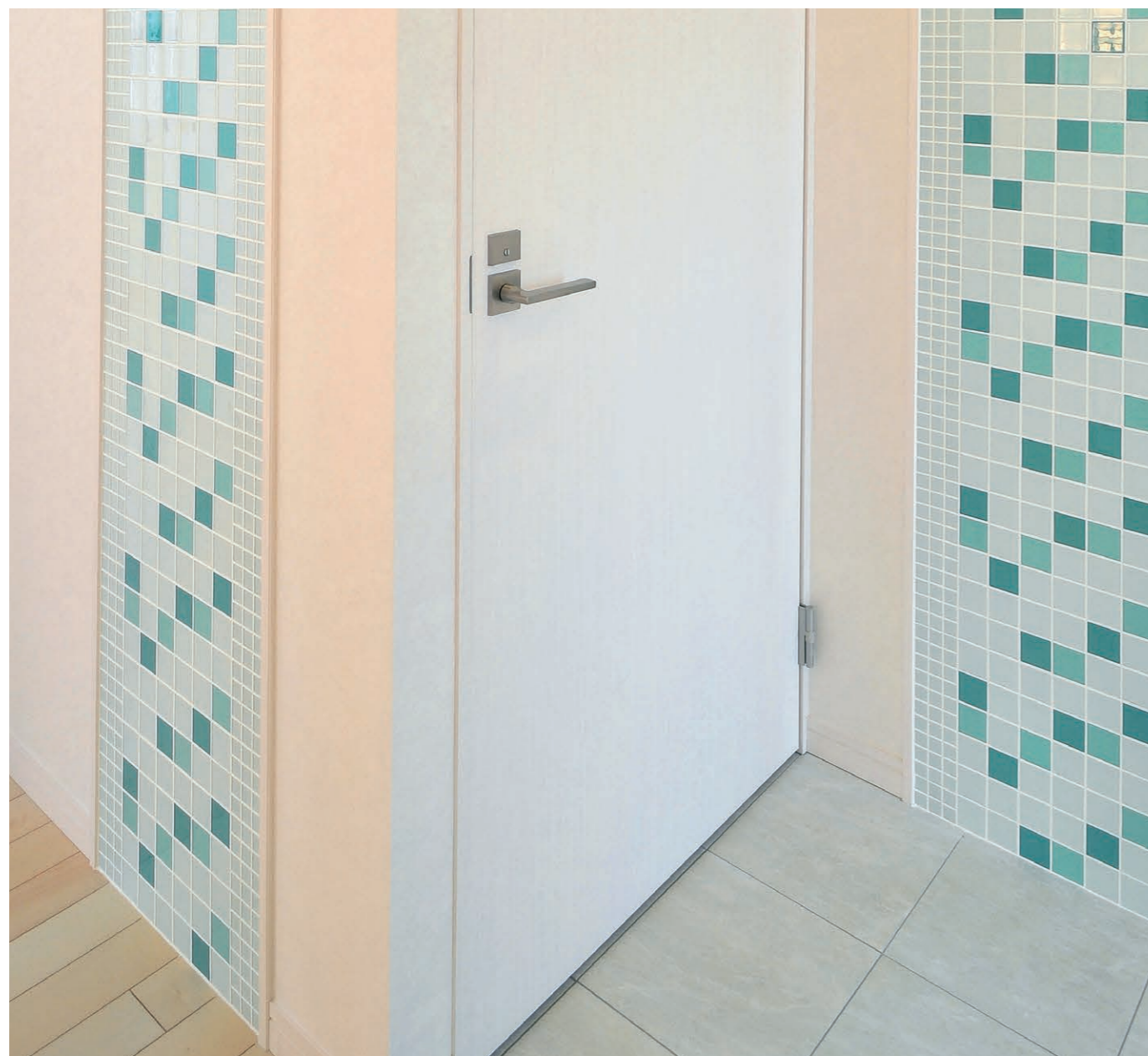
CAG-1001/50MM, 25MM, 特注品