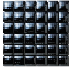
MIR-13 (ブラック・ラスター)