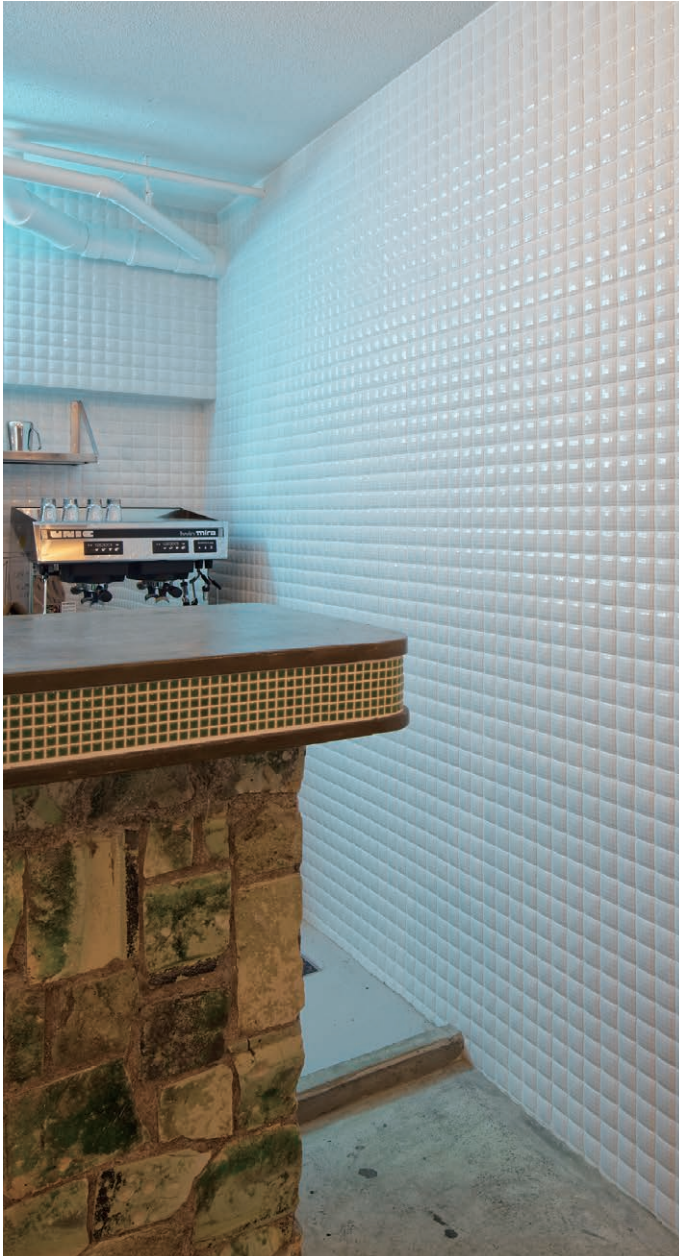
MIR-01/47MM 撮影協力: awj