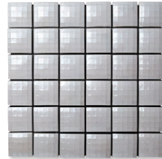
MIR-11 (ホワイト・ラスター)