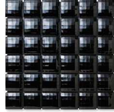
MIR-03 (ブラック・ブライト)