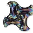
VCLA-3LT(ブラックラスター)