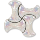
VCLA-1LT(ホワイトラスター)