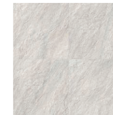
STW-100 (クォーツサイト ピアンカ/石英岩)