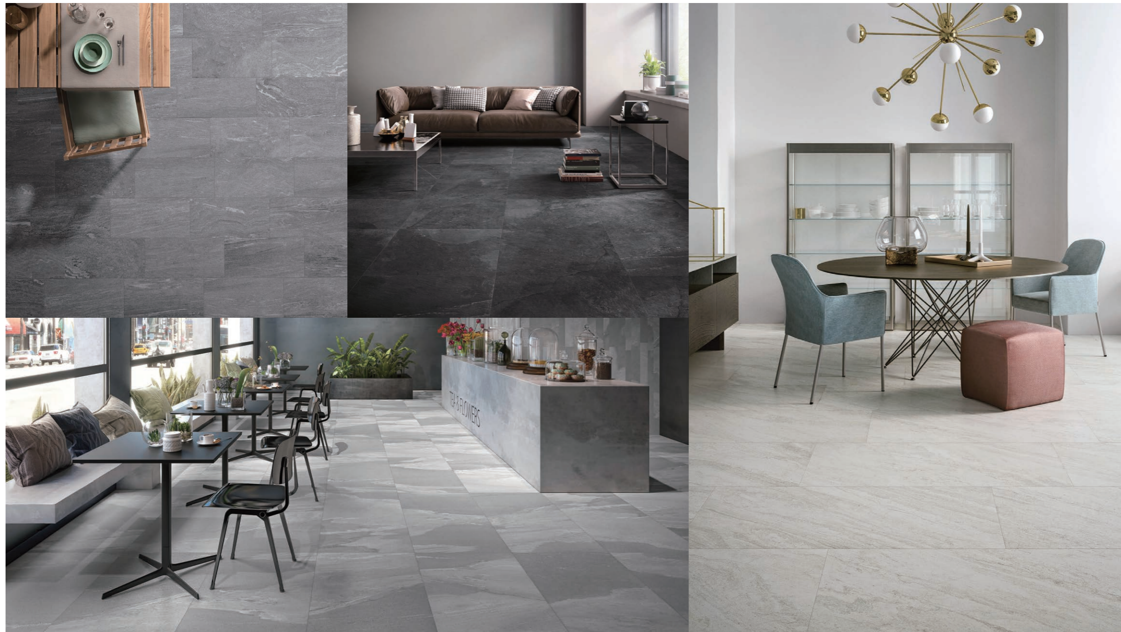
左上 STW-102/600×300RH, 右上 STW-103/600RH, 下 STW-101/1200×600