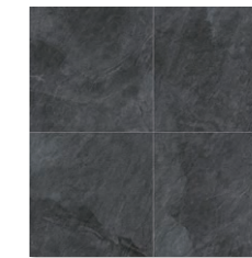
STW-103 (アルデシア ネラ/石盤石)