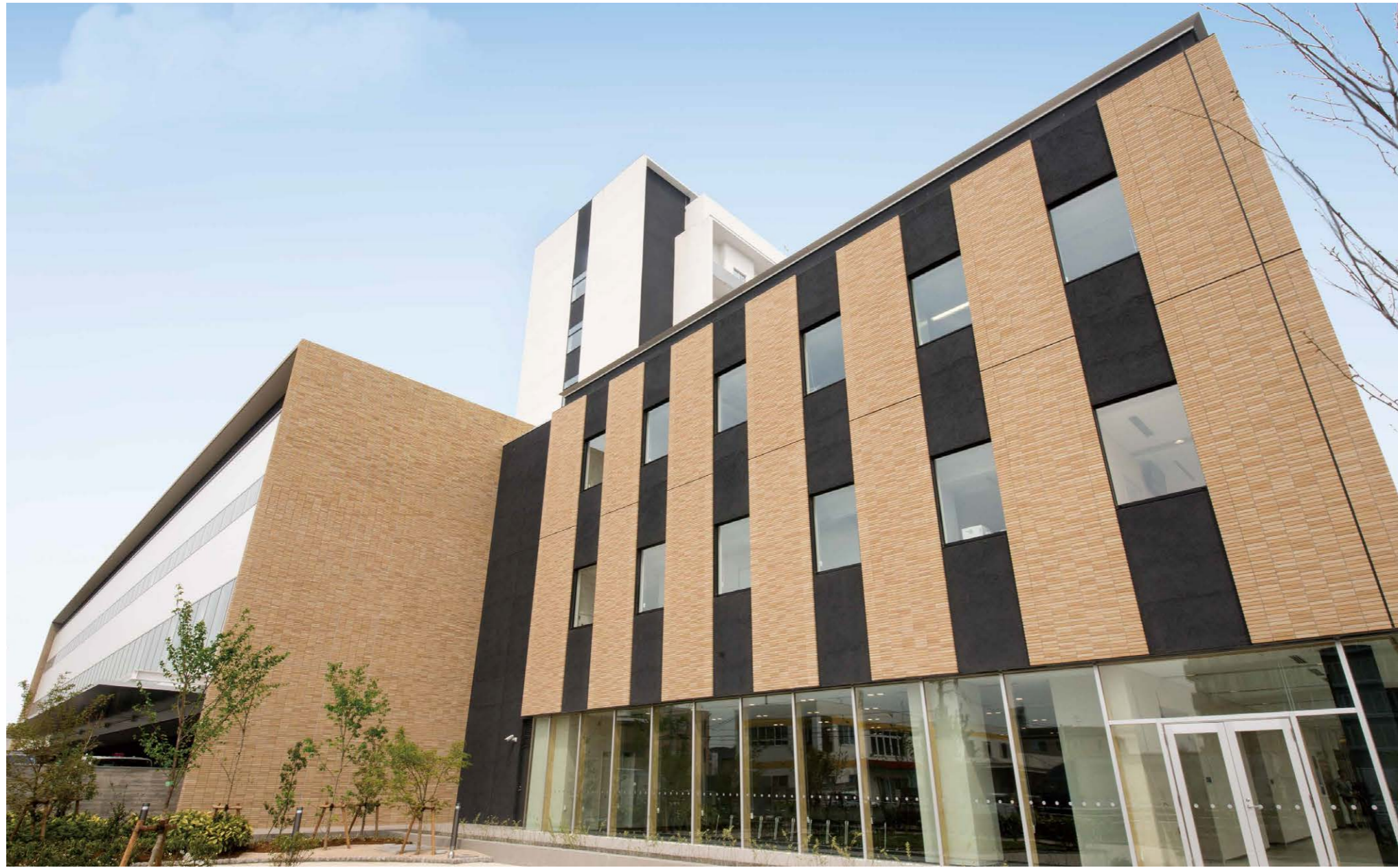
CL-20/ボーダー 撮影協力：岡山市立市民病院 設計：株式会社久米設計