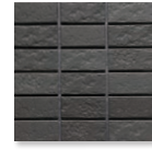
CDS-109 (グリーンブラック)