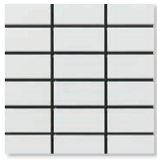
SNW-00N (スーパーホワイト)