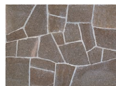
DNS-906(ポルフィーノ/アルゼンチン)