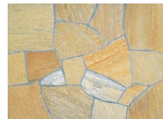
DNS-903(アルビノイエロー/ブラジル)