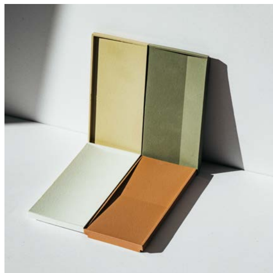
Teruhiro Yanagihara Studio