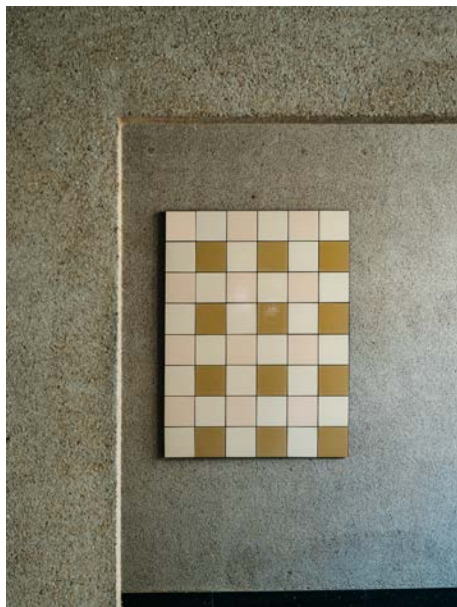
Teruhiro Yanagihara Studio